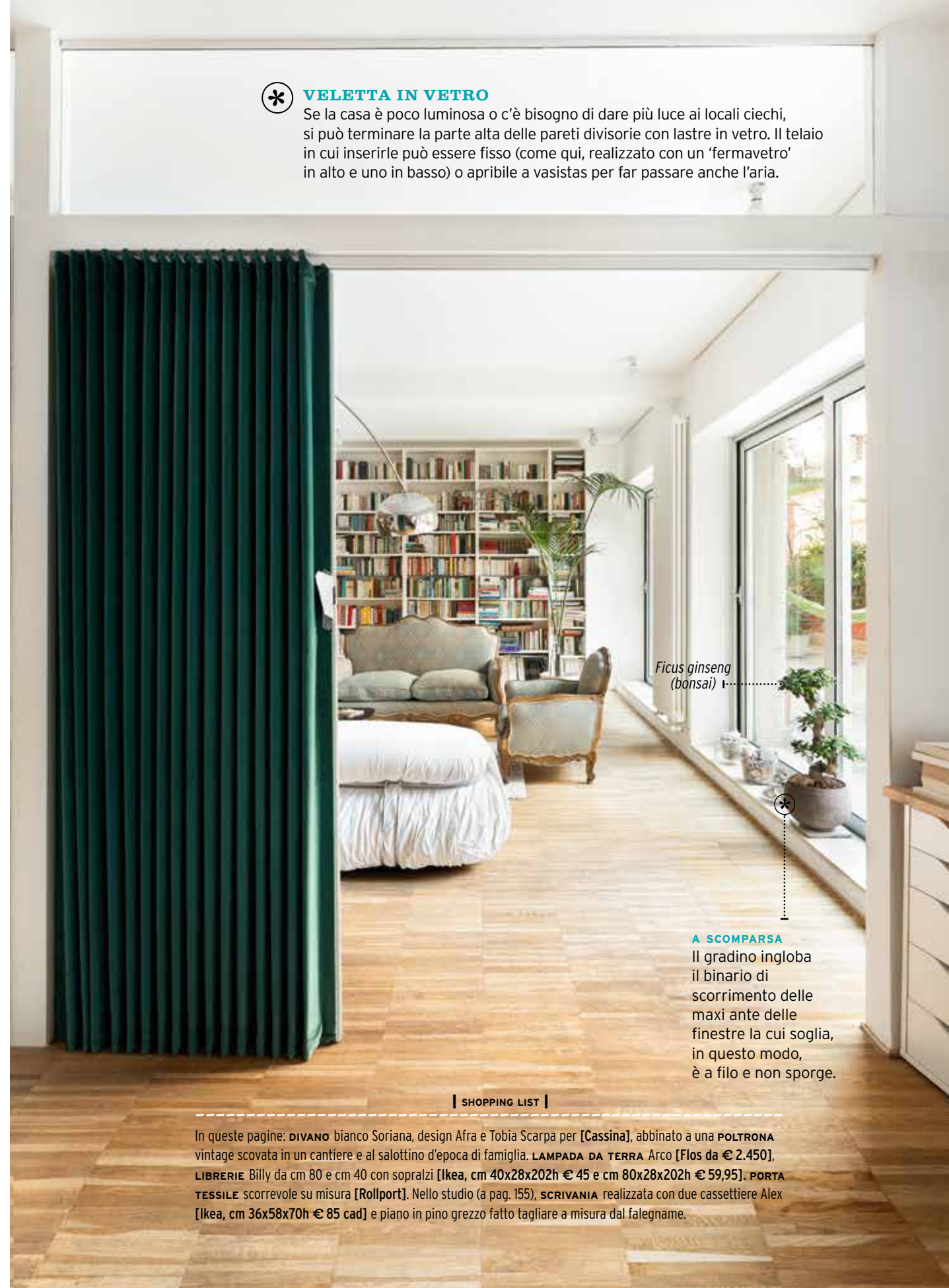
Ficus ginseng (bonsai)

Se la casa è poco luminosa o c'è bisogno di dare più luce ai locali ciechi, si può terminare la parte alta delle pareti divisorie con lastre in vetro. Il telaio in cui inserirle può essere fisso (come qui, realizzato con un 'fermavetro' in alto e uno in basso) o apribile a vasistas per far passare anche l'aria.